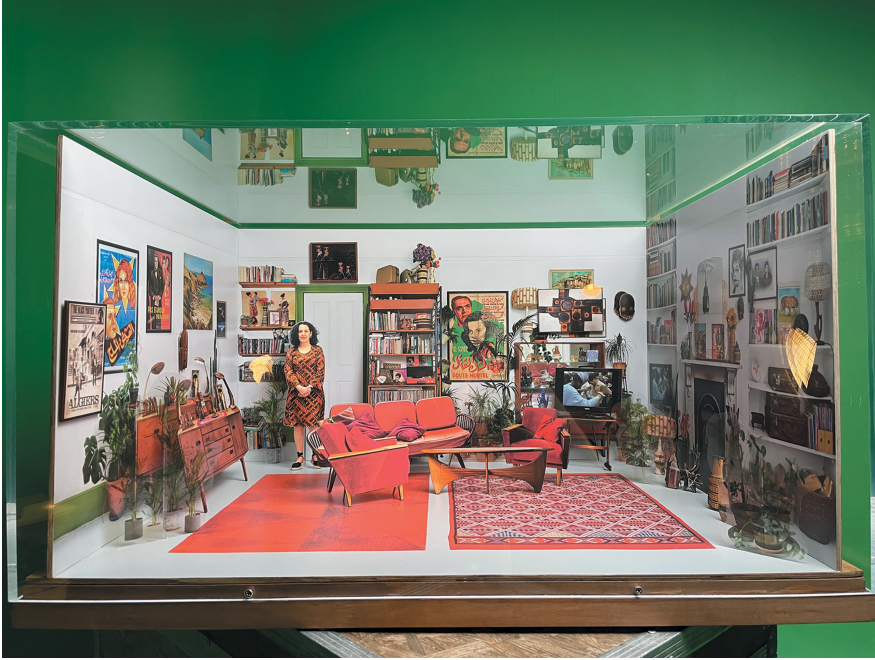
Figure 1: Installation View, Les rêves n'ont pas de titre / Dreams have no titles , Zineb Sedira, French Pavilion, Venice Biennale 2022.

something that disturbs our shared sense of history and, precisely in this way, thinks the world as a space of shared experience?