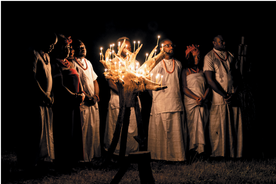
Figure 6: Iyagbon's Mirror – Edo Cultural Forum Graz performing the last scene, 2021.

more traditional academic discourse. The participative dimension of re-staging requires more than a critical regard from the viewer and can produce and reinvent social realities. 7 I have experienced this first hand and turned my camera to documenting the process, for example in my film Te Moana (2020), which follows a repatriation from the UK to Maori in Aotearoa New Zealand. 8 The repatriated in that case created a funeral for ancestors, a dimension that merely calling repatriation Eurocentric cannot encompass. There is much that remains incommensurable, wounded, and unresolved in repatriations, which is all part of the complexity of processes at work within them. As artists, performers, and collaborators on artistic research with stakeholder communities we are in a unique position to reflect on the movement of the originals within the same medium that they are – bronzes recast, spoken words resung, ceremonies reenacted.