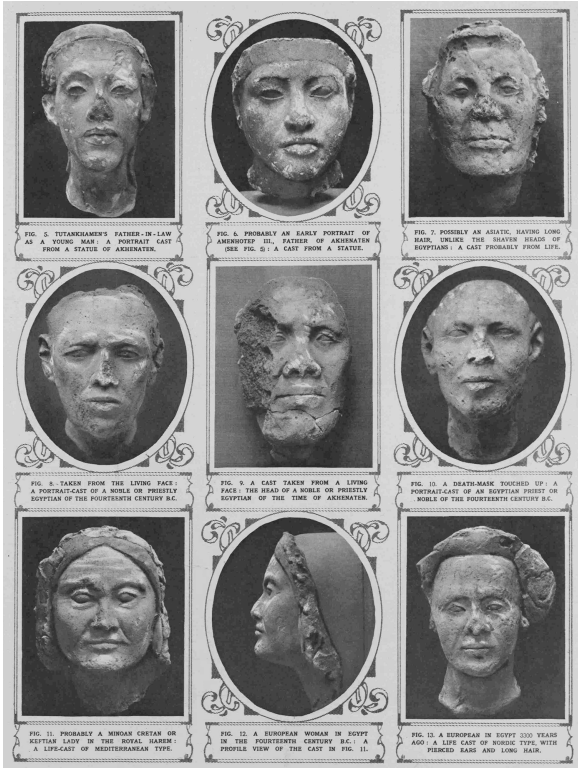
Figure 5: Sculptures and live plaster casts discovered in Tell el-Amarna. Photographic montage published as “Portraits of 1370 BC from an Egyptian studio” in Illustrated London News (19 March 1927, 3).

The awareness of being woman and the taste for Otherness; an incorporation of the Other into the substance of Self; de-centring and re-centring. There is no doubt that museums are among the places where the “singular physical property of Europe”, to use Paul Valéry’s words again, its extraordinary absorption and assimilation power, is visible at its strongest. Museums are, or have long been, the sites of formal encounters with vast worlds, the archives of human creativity, some of the places where History fertilises the future. And, if I were not afraid of pomposity and if so many European museums had not been excessively commodified and “touristified” over the last few years, I could almost say that they are the house of the mind.