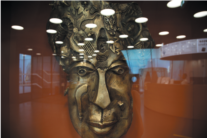
Figure 1: Iyagbon's Mask in Graz , 2021.

exploring the potential of replicas to mediate the spaces left in museums when looted artifacts are repatriated. 2