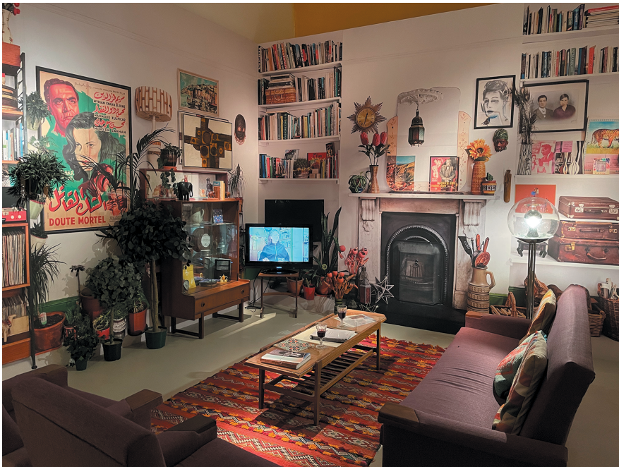
Figure 3: Installation View, Les rêves n'ont pas de titre / Dreams have no titles , Zineb Sedira, French Pavilion, Venice Biennale 2022.

We are the ones now inside the display case. One of the pavilion’s side rooms is furnished just like the dollhouse, as if this little scene offered a set of building blocks for real life (Figure 3). In the same spot where the cardboard figure of the artist stood just a moment ago, we now find ourselves in the middle of a living room. This is a play with scales. The aquarium-like microcosm that seemed to represent Zineb Sedi-