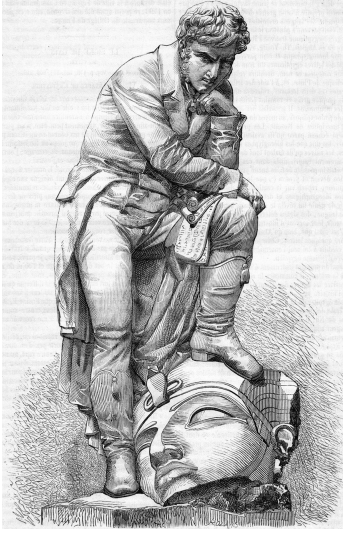
Figure 1: Champollion, marble statue of Bartholdi, drawing by Sellier. Le Magasin pittoresque (vol. XLIV, July 1876, 233).

David vanquishing Goliath; or, when the head belongs to a ferocious beast, to images of archangels or saints slaying the demon. What was Bartholdi trying to say? I do not know.