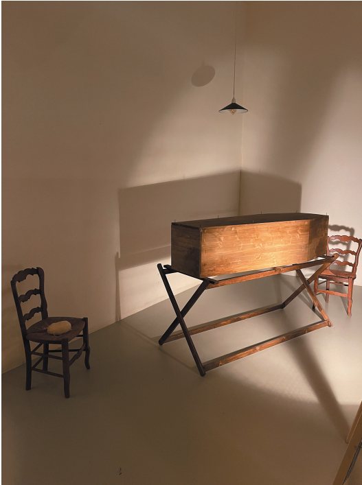
Figure 5: Cinema Installation View, Les rêves n'ont pas de titre / Dreams have no titles , Zineb Sedira, French Pavilion, Venice Biennale 2022.

concept of culture itself that was brought about primarily by music and film. 5 This altered concept is characterised by an ambivalent relationship to the new possibilities of film – because of course we have also been left with a cinema of “la douce France”, a tradition that produced imagery for the new, bourgeois world of the “Trente Glorieuses”, the 30 golden years (1945–1975); and at times this cinema reduced the colonial question to mere kitsch. The many film reels piled up to fill the main room invoke cinema itself as a myth of French post-war