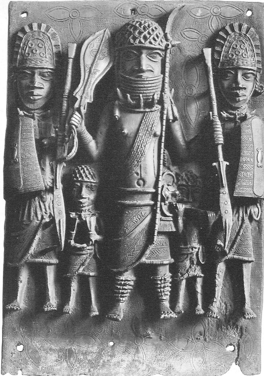
Figure 2: Benin Bronze.

civilization”. 3 Astounded art historians saluted the virtuosity of these works, which reminded them of European Renaissance or Baroque art. They had difficulty accepting them as the production of an African people.