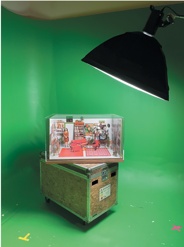
Figure 2: Installation View, Les rêves n'ont pas de titre / Dreams have no titles , Zineb Sedira, French Pavilion, Venice Biennale 2022.

late-sixties and early-seventies decor, with overly bright, pop art posters on the walls, red seat cushions, records, small objects, and other ornaments. At first glance, all of it has the look of a charming dollhouse, a piece of self-reassuring kitsch from an idealised age. Does this installation present us with the intérieur of a society that has been seized, time and time again, by the desire to exhibit its culture? Does it mean to embody the “nation universaliste”? Stepping into the main room of the pavilion, one has precisely this impression, because the overall scenario immediately evokes a feel-good cliché: an old-time bar (it’s hard not to think of the “fabulous” world of