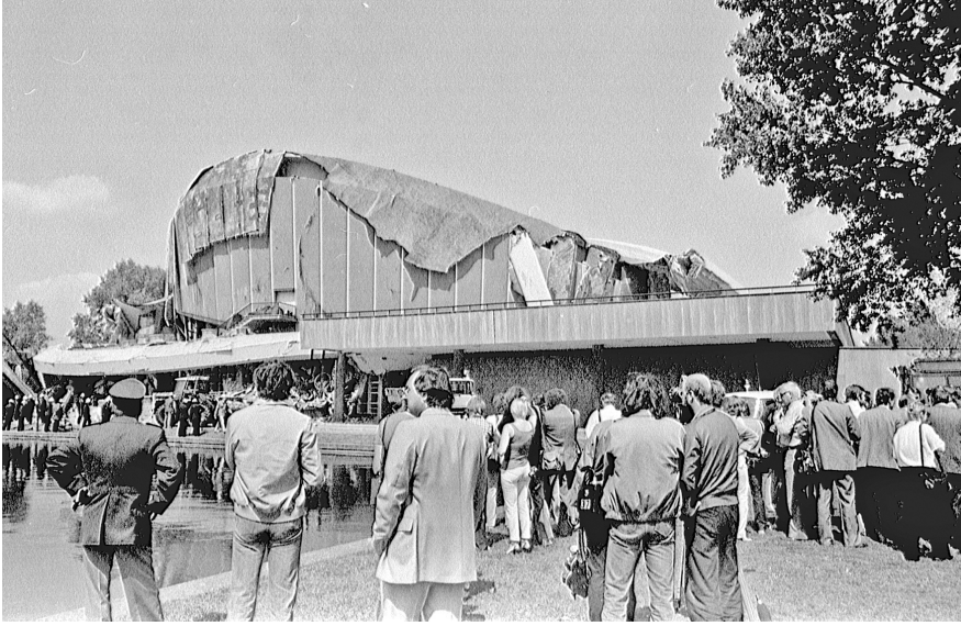
Figure 7: Congress Hall Berlin, 18 May 1980, Credit: Herbert Orth. Public Domain.

The positions developed by our artistic residencies derived from situated forms of doubt and from engaging with dominant forms of discourse through the minor; they share an urgency to work with the birth of a world within the ruins of the former West. And in speaking of ruins, we do not use the term metaphorically or playfully (see Figure 7). The artists were invited to respond, react, or altogether develop their own minor practices in response to the exhibition space, chosen to be the central auditorium of the former Congress Hall, now Haus der Kulturen der Welt (HKW) in Berlin. This space is laden with historical and contemporary significance pertinent to our project, since it was gifted to West Berlin by the United States as a token of the country's commitment to liberty, liberalism, modernism, and the "free world". However, when the free-floating modernist crumpled with it, offering us an apt starting point for our exhibition.