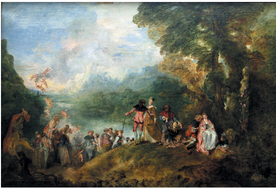
Figure 4: Antoine Watteau: Pilgrimage to the Island of Cythera , also called The Embarkation for Cythera , 1717. Oil painting on canvas, 129 × 194 cm, Louvre Museum, Department of paintings, inv. 8525. Public Domain.

In the following weeks and months, long before Watteau's works reached Debussy and touched his heart, the young Strauss started composing the music for a vast ballet called Kythere (opus AV 230, Trenner 201), which remained fragmental but which provided some of the themes of Der Rosenkavalier , Ariadne auf Naxos , and Josephslegende (Schuh 1960). Pierre Rosenberg called the Pilgrimage to the Isle of Cythera "at once a pause and an action, an instant, but beyond all time" (2007, 901). This fine wording could be used to describe museums in general. They are all at once, the stopping of artworks, which are immobilised and forever imprisoned in displays and on walls, and the powerful, gripping action of these works on the generations that pass before them.