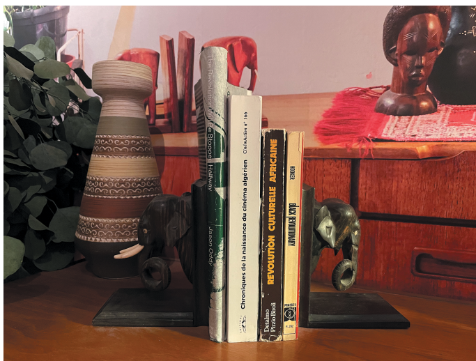
Figure 4: Installation View, Les rêves n'ont pas de titre / Dreams have no titles , Zineb Sedira, French Pavilion, Venice Biennale 2022.

ra's individual story becomes that of our own, or at least we are suddenly implicated in this world. And now, as we inspect its features, we begin to see so many details that provoke so many questions. There are photos of Algerian landscapes hanging on the walls, alongside family photos and a potpourri of film posters, many of them of Arabic origin, such as the poster for Le doute mortel ( The Murderer's Suspicion , 1953) by the Egyptian director Ezz el-Din Zulfikar, whose work deeply influenced Arabic cinema. Wooden elephants serve as book stands, mixed in with African masks. There are records by the Algerian singer Zoubida and by the American Bob Destiny, the actor and musician who taught at the Théâtre National Algérien in the late 1960s and early 1970s. And of course there is the library, with editions of Présence africaine and the work of Frantz Fanon alongside Sartre and Lacan, with Detalmo Pirzio-Biroli's Révolution culturelle africaine , James R. Hooker's Black Revolutionary , and Guy Hennebelle's Chroniques de la naissance du cinéma algérien (Figure 4).