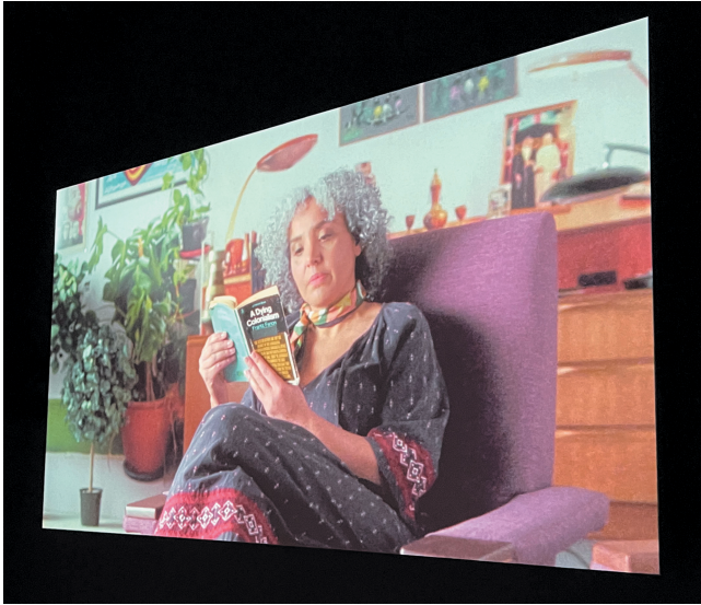
Figure 6: Coffin Installation View, Les rêves n'ont pas de titre / Dreams have no titles , Zineb Sedira, French Pavilion, Venice Biennale 2022.

For the Algerian to ask for L'Express , L'Humanité , or Le Monde was tantamount to publicly confessing – as likely as not to a police informer – his allegiance to the Revolution; it was in any case an unguarded indication that he had reservations as to the official, or “colonialist” news; it meant manifesting his willingness to make himself conspicuous; for the kiosk dealer it was the unqualified affirmation by that Algerian of solidarity with the Revolution. The purchase of such a newspaper was thus considered to be a nationalist act. Hence it quickly became a dangerous act. Every time the Algerian asked for one of these newspapers, the kiosk dealer, who represented the occupier, would regard it as an expression of nationalism, equivalent to an act of war. Because they were now really committed to activities vital to the Revolution, or out of understandable prudence, if one bears in mind the wave of xenophobia created by the French settlers in 1955, Algerian adults soon formed the habit of getting young Algerians to buy these newspapers. It took only a few weeks for this new “trick” to be discovered. After a certain period, the newsdealers refused to sell L'Express , L'Humanité , and Libération to minors. Adults were then reduced to coming out into the open or else to falling back on L'Écho d'Alger . It was at this point that the political directorate of the Revolution gave orders to boycott the Algerian local press (Fanon 2002 [1961], 81).