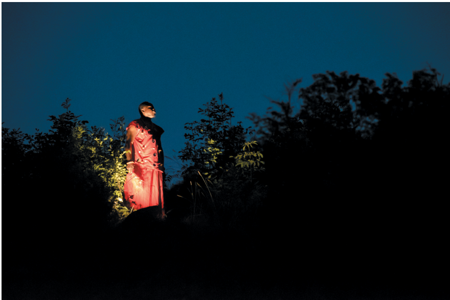
Figure 4: Iyagbon's Mirror – Samson Ogiamien. Performance still, 2021.

The reason the repatriation debate recurs, as Savoy and Sarr have historicised in their report for French President Macron Relational Ethics (2018), is, because it is a symbolic transfer, potent with the potential to signal awareness and willingness to repair this colonial wound (Sarr and Savoy 2018; see also Savoy 2021). By performing together in public space, collective action becomes foregrounded rather than an individual monetary interest, which often derails repatriation claims. Since the theatre allows us to create a micro universe in which to experiment with ideas, Iyagbon's Mirror built precisely the boat in which we are all sailing in the wake of the third passage (Sharpe 2016).