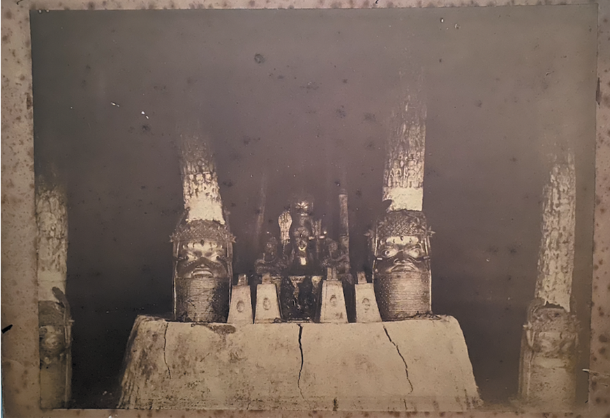
Figure 5: Earliest known photograph of Oba's compound, Benin City, May 1891. Photo credit: Cyril Punch. Public Domain.