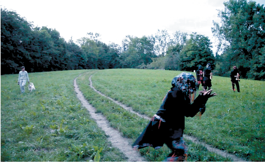
Figure 3: Iyagbon's Mirror – first ritual scene in Rosengarten Graz, 2021. Video still from a film by Khadija von Zinnenburg Carroll.

Europe, the African diaspora lives their culture in relative separateness to the mainstream.