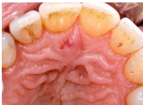
Abb. 1 Die Papilla incisiva imponiert palatinal vom Zahn 11 leicht gerötet. Zudem sind generalisiert tabak-assoziierte Verfärbungen an den Zahnflächen zu erkennen. Der Patient ist Raucher (ca. 30 pack-years).

SCHLÜSSELWÖRTER: Persistierender Ductus nasopalatinus, Canalis nasopalatinus, digitale Volumetomografie