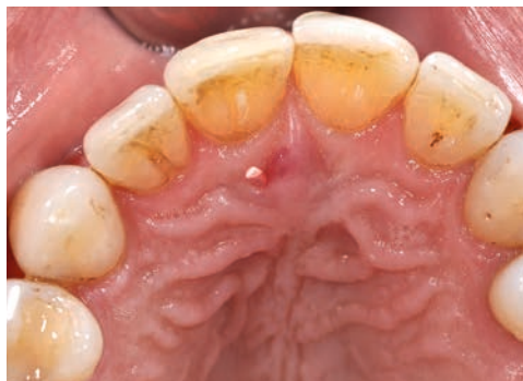
Abb. 2 Nach Lokalanästhesie palatinal konnte eine Guttaperchaspitze (ISO 50) in der Falte der Papille rechts unterhalb der geröteten Zone regio 11 bis auf eine Tiefe von 15 mm eingeführt werden.

Der Ductus nasopalatinus (DNP) entsteht innerhalb des Canalis nasopalatinus aus Epithelresten und entwickelt sich danach zu einer epithelialisierten Verbindung, welche von der Mundhöhle zur Nasenhöhle reicht. Normalerweise kommt es beim Menschen vor der Geburt zum Verschluss oder zur Degeneration des DNP. Persistiert der DNP auch nach der Geburt, können sich orale Öffnungen bilateral, unilaterial oder auch zentral zeigen.