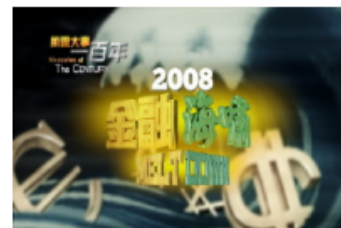
2008 金融海嘯 (國際台/亞洲台)